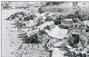
I rifiuti nei pressi del Sert

Esposto di attivisti dei meetup «Amici Beppe Grillo Crotona» e «Crotona in Movimento»