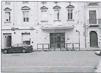
Il palazzo della Provincia